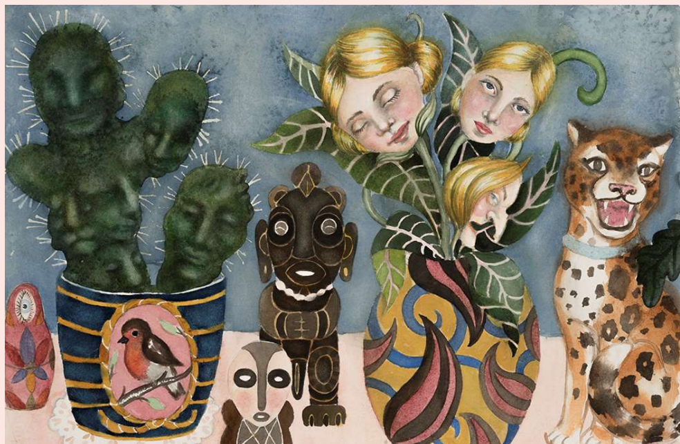
Julie Nord Vindueskarm , 2021 Akvarel, 40 x 58 cm.