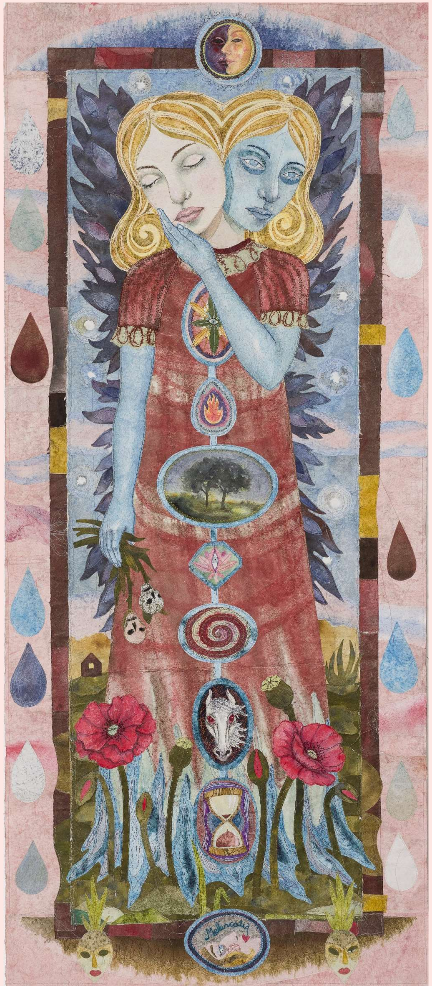
Julie Nord Melankoli , 2024 Akvarel og sytråd på japanpapir 230 x 106 cm.