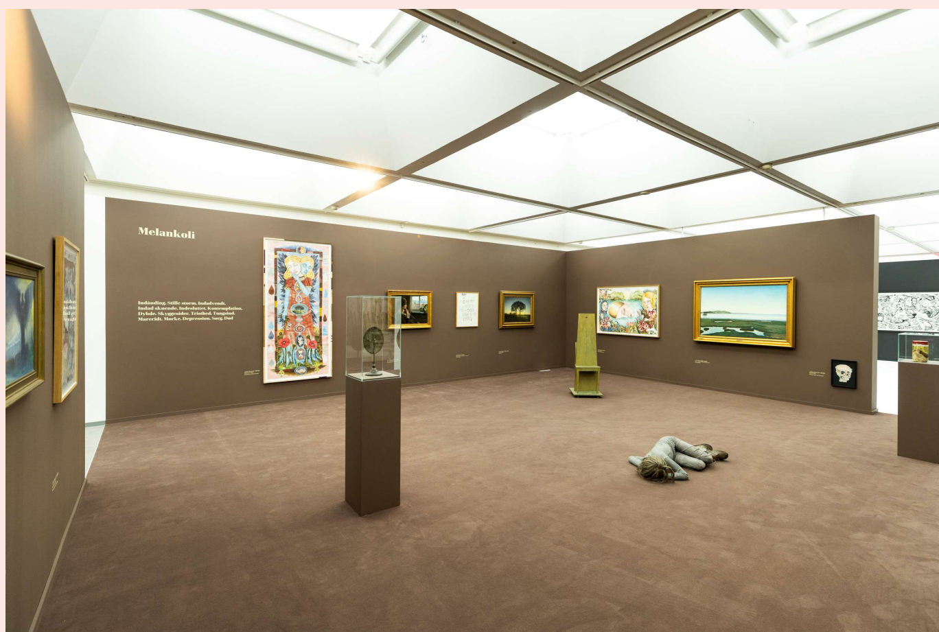
Udstillingsvue fra Julie Nord - JÆRTEGN , 2024.