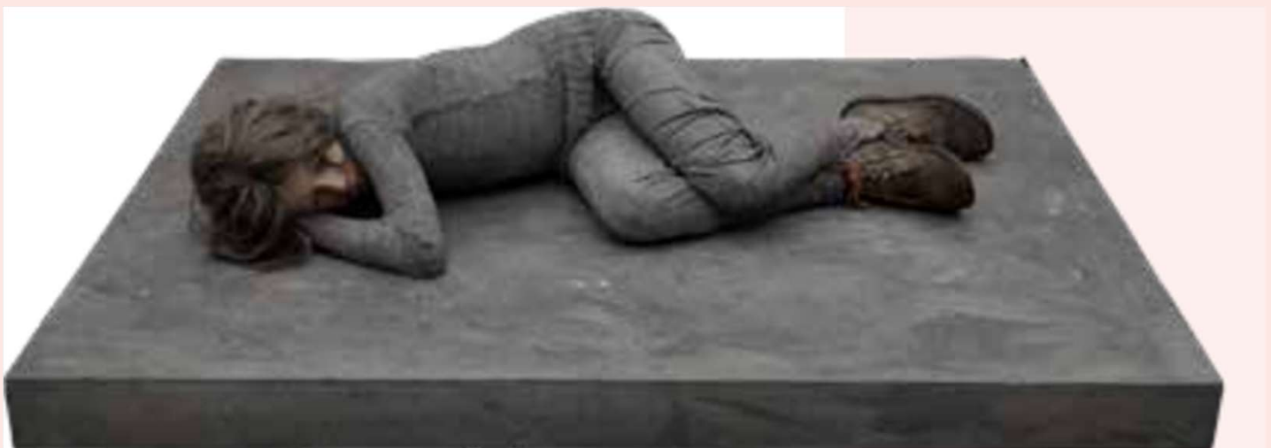
Kurt Trampedach: Liggende dreng (Henrik) , 1979. Blandede materialer, 35 x 122 x 149 cm.