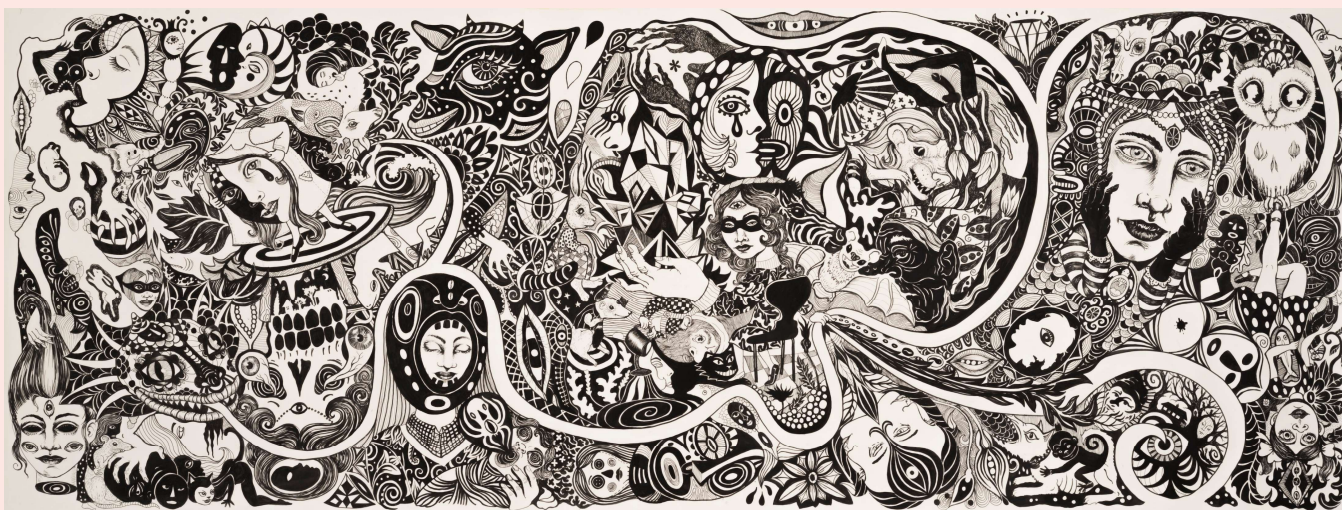
Julie Nord: En Vinternat , 2017. Tusch på papir, 302 x 115 cm. KUNSTEN