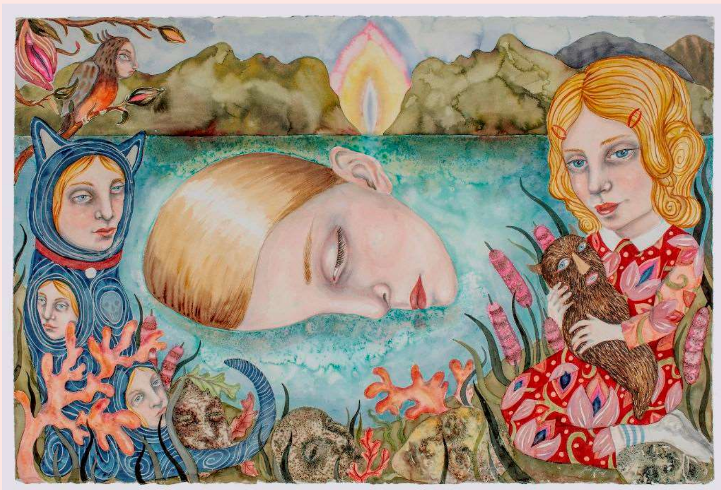
Julie Nord: Still water , 2021. Akvarel og tusch på papir, 102 x 152 cm

Hver måned udvælger museet en favorit. Præmien er et gavekort på 200 kr. til museets butik.