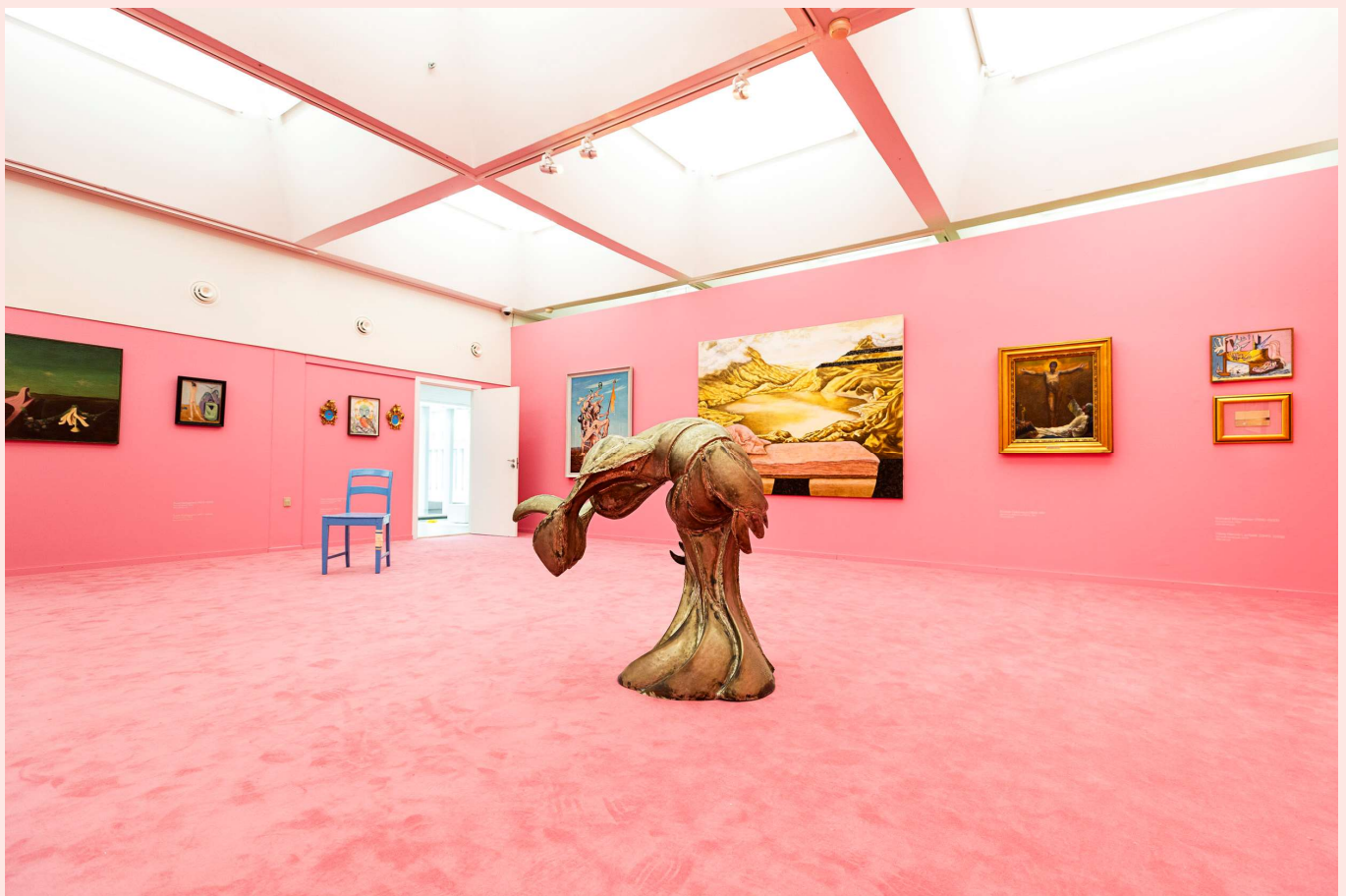
Udstillingsvue fra Julie Nord - JÆRTEGN 2024.